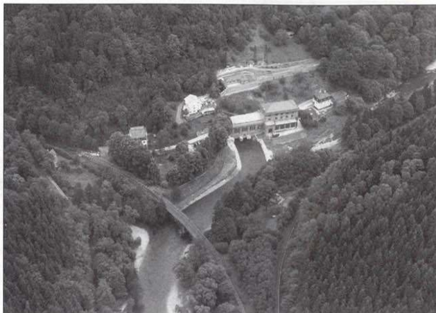
Soutok Jizery a Kamenice se spálovskou hydroelektrárnou

Vjezd cyklistům na Riegrovo stezku zakázán!